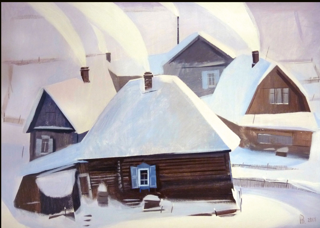
Дымы. Розовое утро