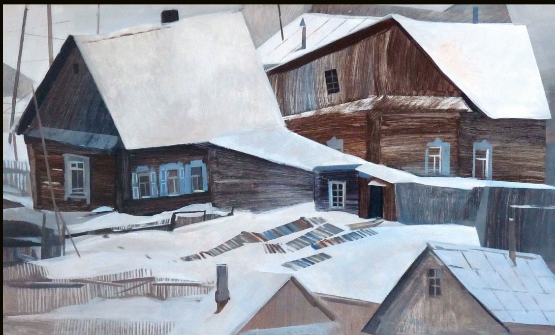
Тишина. Лист 2