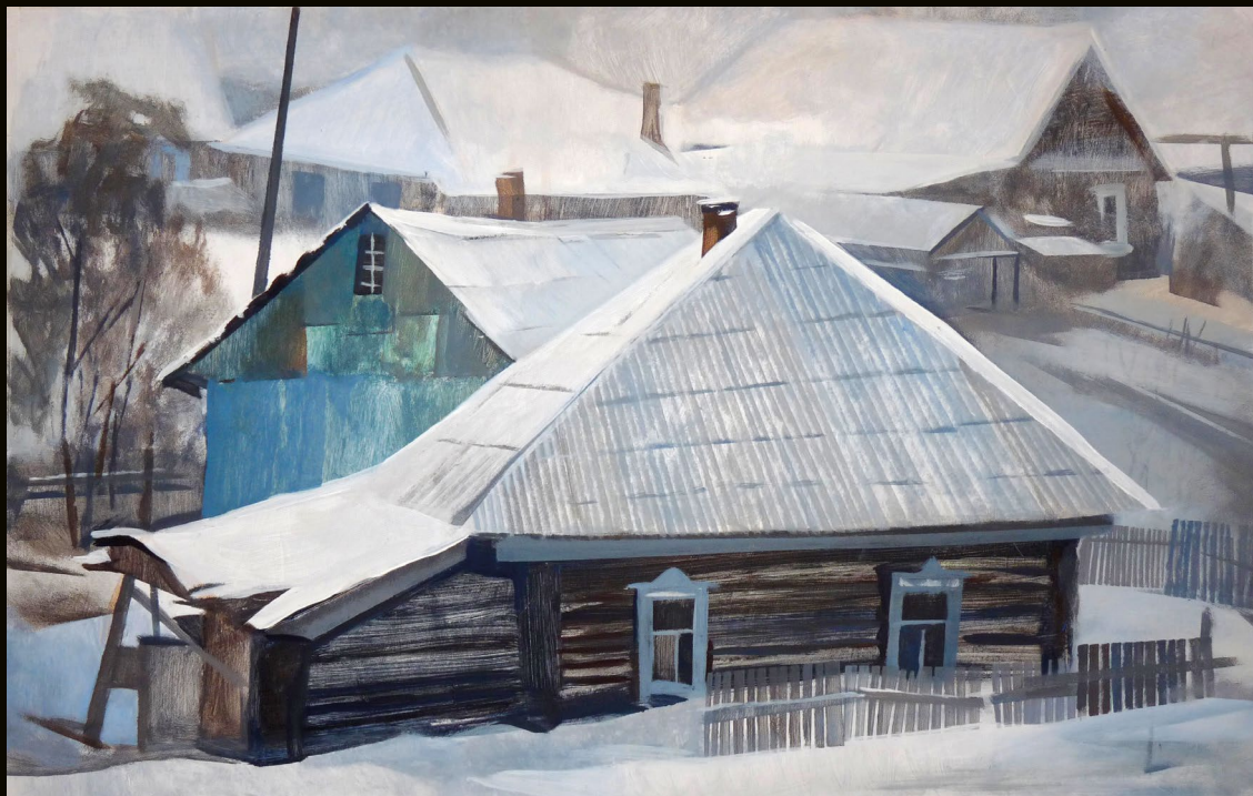
Тишина. Лист 1