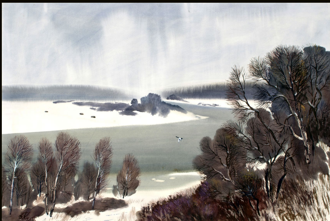
Стынет вода | 70×100 | 1993