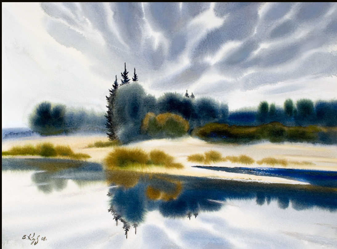
Природы храм нерукотворный | 56×76 | 2000