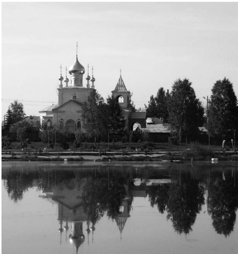
Храм над речкой Ингашкой